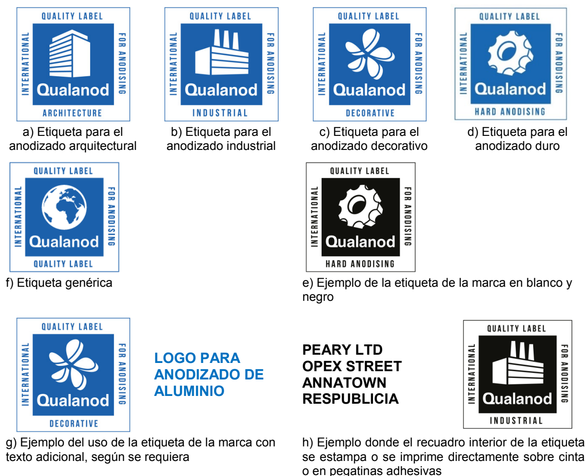
Figura 1. El uso de las etiquetas de la marca de calidad

El titular está obligado a aportar al licenciatarario general, en todo momento, cualquier información que se le requiera con respecto al uso que hace de la marca de calidad.